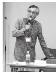
▲長澤忠徳 (武蔵野美術大学学長)